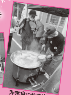
非常食の炊き出し 模擬訓練の様子