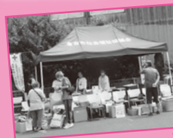
被災地の義援金募集 パザーの様子