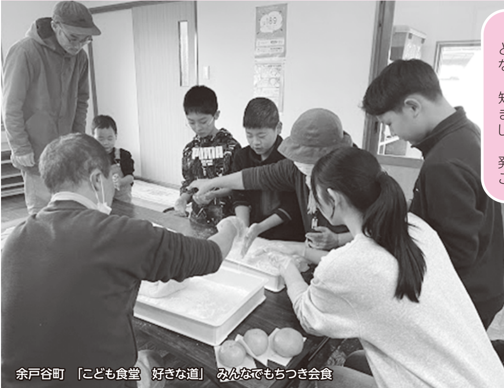
余戸谷町 「こども食堂 好きな道」 みんなでもちつき会食

みなさまからの募金で、子どもからお年寄りまで、みんなで楽しく交流できました。住民のみなさまに活動を知っていただく機会にもなりました。ありがとうございました。インスタグラムでも活動を発信していますので、ぜひご覧ください！