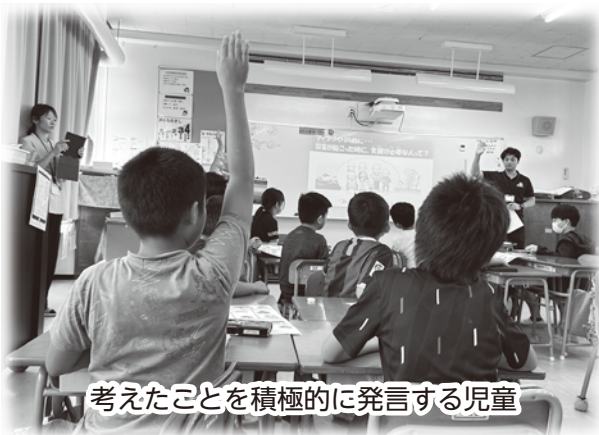
考えたことを積極的に発言する児童

今回は架空の町で生活する住民の情報をもとに、どんな支援や声掛けができるのかを話し合いました。