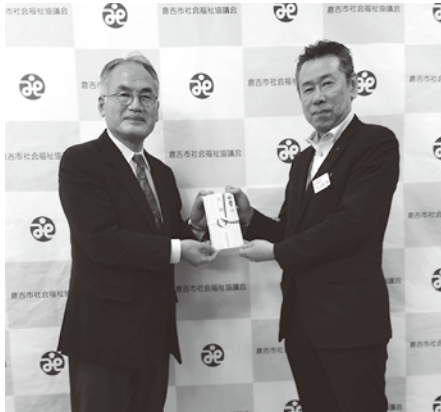
住友生命保険相互会社様 (右)