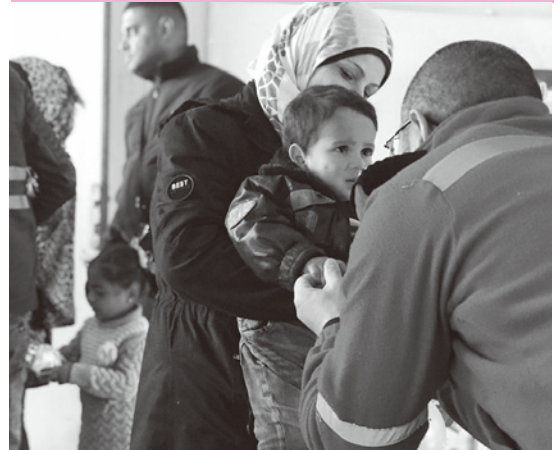
赤十字社によるウクライナ人道支援のようす