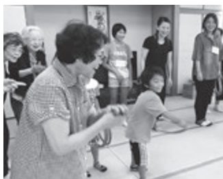
いきいきサロン活動のようす(高齢者と小学生の交流)