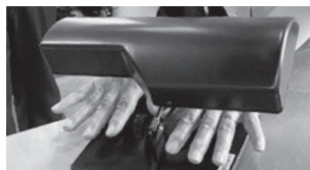
チェッカーで洗い残しの検査