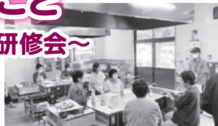
食品衛生協会 改正食品衛生法の説明