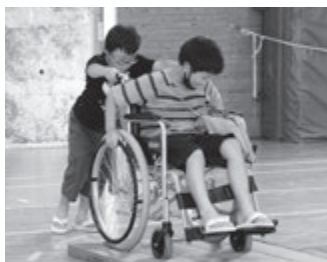
小学生の福祉学習のようす(車いす体験)