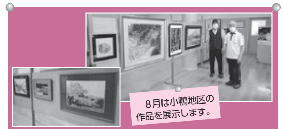
8月是小鴨地区の作品を展示します。

どれも細かい部分まで表現されていて、きめ細やかさが伝わりと同時に迫りも感じさせていただいた作品でした。