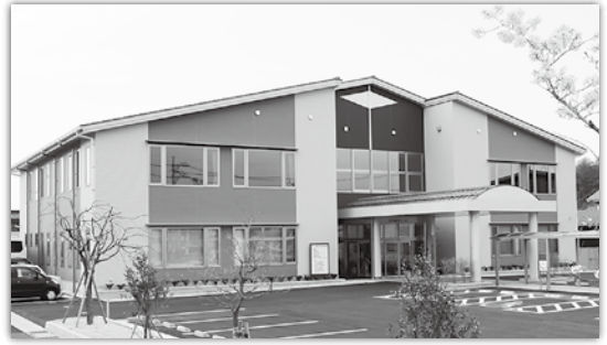
倉吉福祉センター 倉吉市福吉町1400番地