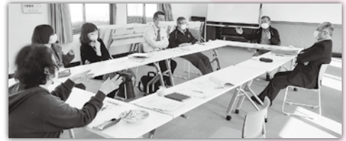
灘手はじめよう会の様子