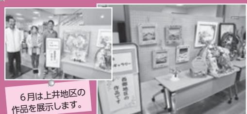
6月は上井地区の作品を展示します。

5月は西郷地区社協より様々な作品が展示されました。かわいいフォトフレーム等をはじめ、手芸品や紙粘土で作られた額など工夫が凝らされた作品でセンターのロビーを華やかに楽しく飾っていただきました。