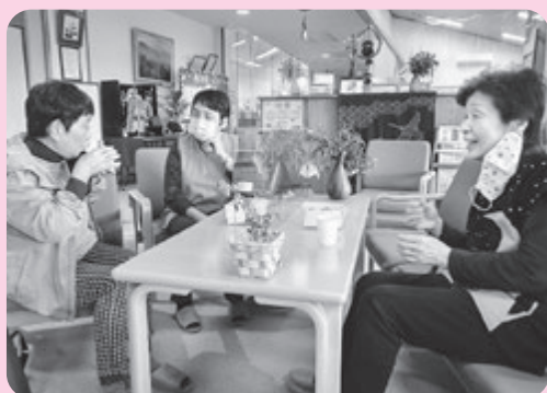
パーティーや換気で感染対策