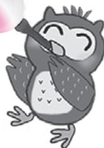
地域福祉課 鈴木 淳

4/1付で入職した鈴木です。まだわからない事が多々ありますが、皆様のお役に立てるよう頑張っていきたいと思っています。よろしくお願いいたします。