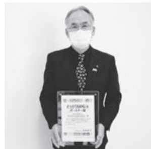
とっとりSDGsパートナー証

倉吉市社会福祉協議会は、「 出会い・つながり・協働によって生まれる新たな価値の創造 」を主題とし、 地域共生社会の実現に向けて、さまざまな事業主体との協働によって地域福祉を築き上げる「中間支援組織」 としての役割を果たすことを基本原則としながら、下記のとおり行動宣言いたします。