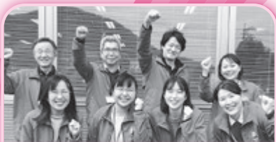
あんしん相談支援センター