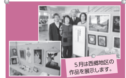
5月は西郷地区の作品を展示します。

4月は上灘地区社協より下田中げんきサロンの作品を展示されました。ガラスアートなどの作品の他、桜沿いの川を渡る船や下田中の街並を再現した作品など、どれも工夫されていて楽しい気持ちにさせていただきました。