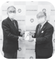
住友生命保険相互会社様 (右)