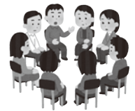
話し合いが行われている