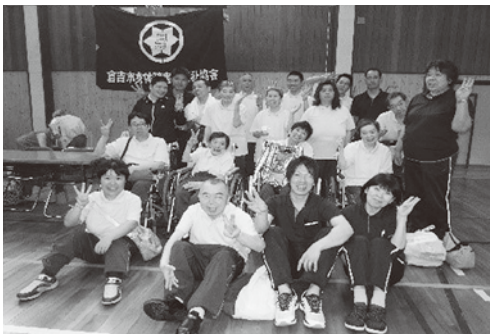
鳥取県のスポーツ大会の様子です!!

身体障害者手帳をお持ちの方や賛助会員の方たちとともに、障がいがあっても住み慣れた地域で安心して暮らせる共生社会を目指して活動しています。