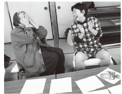
地域の絆づくりのために ふれあい・いきいきサロン活動

今年も全国一斉に赤い羽根共同募金運動が始まりました。 10月1日には倉吉市共同募金委員会関係者や施設関係者等が倉吉駅前 に立ち、駅を利用する人たちに募金の協力を呼びかけました。 募金運動は、街頭での活動のほか、家庭、学校、職場、企業、スーパーなど の身近なところで行っていますので、皆様の温かいご理解とご協力をお願い いたします。 お寄せいただいた募金は、あなたの地区の福祉活動や福祉教育、福祉団体 の活動、福祉施設、保育所等の改修など、私たちの地域の身近な福祉活動に 役立てられます。