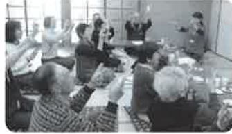
地域サロンの様子