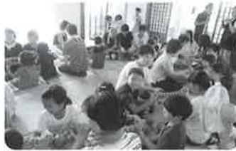
小学生と地域サロンの交流