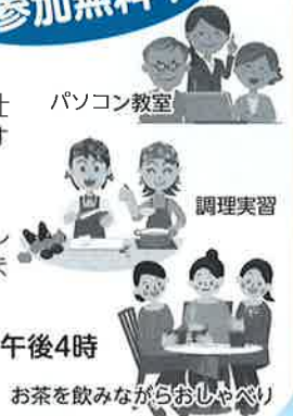
お茶を飲みながらおしゃべり