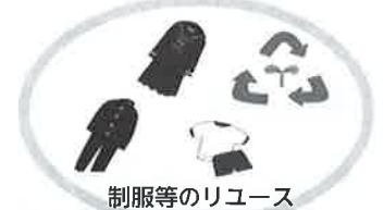
制服等のリユース