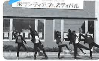
倉吉北高 ダンスパフォーマンス