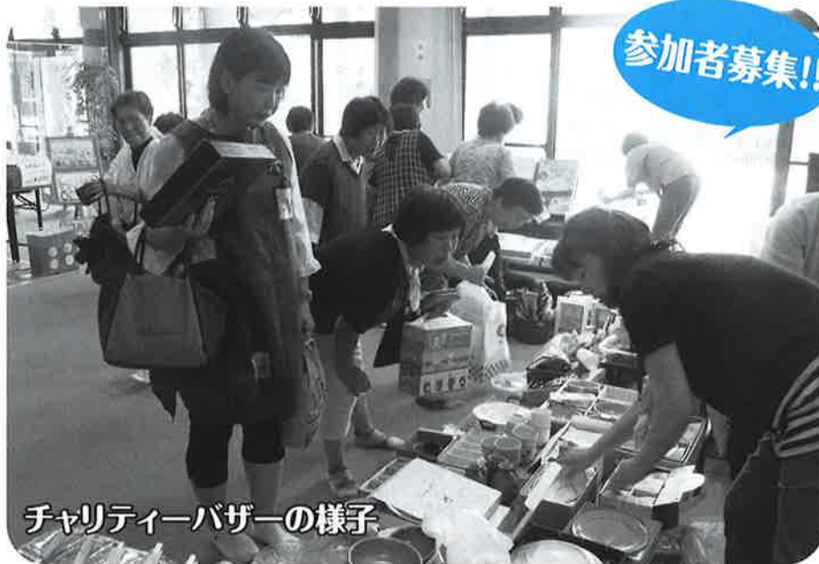
チャリティーバザーの様子

場所 倉吉市高齢者生活福祉センター(倉吉市関金町関金宿1115番2) 参加費 無料