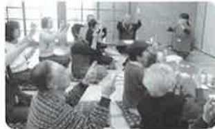
サロンでの専門職によるレクリエーション