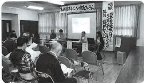
第10回倉吉市こころの健康フォーラムの様子

精神障がいのある人やその家族の人権が守られ、安心してのびのびと暮らせる社会をめざしています。