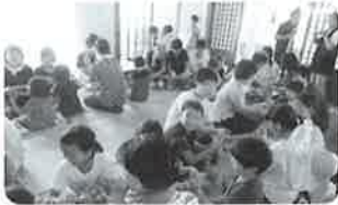
小学生と地域サロンとの交流

すべての市民が一人ひとりの暮らしと生きがいを、ともに創り、高め合うことのできる地域共生社会の実現に向けて、身近な地域における見守り活動やふれあい活動を通じた地域づくりと、市民と専門職等とのネットワークによる支え合いの仕組みづくりを進めます。