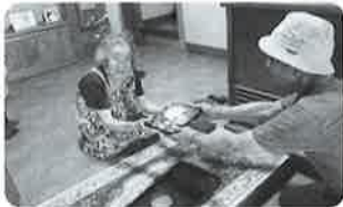
笑顔をお届けする給食サービス