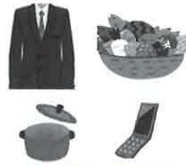
倉吉くらしの応援団