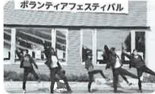
倉吉北高 ダンスパフォーマンス