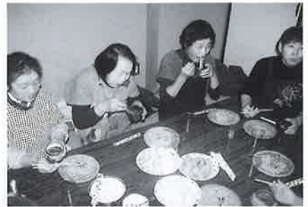
「収穫祭」での至福のひと時