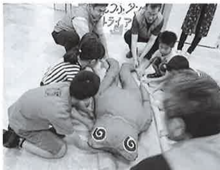
動けなくなってしまったカエルさんのために毛布で担架を作りました！