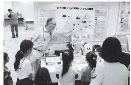
災害時に役立つ道具はなにかなあ？