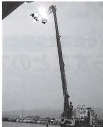
災害時に活躍する車両の見学

防災に関する知識を学んだり、中国地方に2輛しかない貴重な災害対策用の車両等を見学しました。防災士会の方に、災害に備えておくものや家具の倒壊防止の工夫など、ゲームを通して、楽しく教えていただきました。「防災ゲームがたのしかった。」「地震や火災が起きた時にどんな準備をしたら良いか分かった。」など、防災についてしっかり学んでいる姿が見られました。地域の防災活動などへの参加を期待しています！