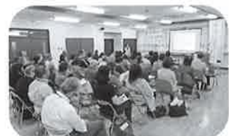
こころの健康フォーラム

精神障がいのある本人とその家族の人権が守られ、安心して暮らせる社会を目指して活動しています。