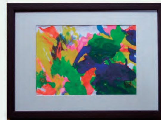
会員のアート作品